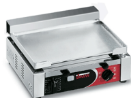
TOP CORT X