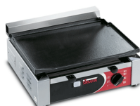
TOP CORT L